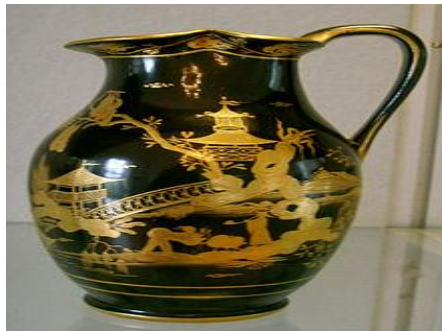
چینیا یی گرایي ( chinoiseries ) یا چیني سریال اوپه لوڅه کی د نقشی کارول

لذا هغه څه چي مونږ په فرانسه کې د چینیا یی گرایي په عنوان توصیف شوی وه یعنی یو ډول نا څرگند او یا مبهم شا با سی ورکونه چي په هغه کې چین دیو بت پرست ټولني په نوم یاده شوی وه ، مگر بیا وروسته له هغه کلیسا دچین سره په مخالفت کې د یهود یا نوپه را جذ بولو کی خپل زغم دلایسه ورکړ او سورین ( sorbonne یا یوپایی غوا ته ) ته جزا ورکړ- په کال (1725) کی غیر قانونی مسیحان چي دچینی مناسکو په عبادت مشغول وه غیر قانونی کیدل اودا ډیر په زړه پوري دي چي پوه شو او هغه داچي سینوفیلی (sinophile) فیلسوفیان او محکوم کرشوی یهودیان چي دپاپ لخوا وغندل شو ټینگار یی وکړ چي «ریننتینی عقیدې» [عیسوی] په پخواني چینیا یا نو او بیا په ځانگړي توگه کنفیوسویانو (confucianisim) متنونو کی تنظیم شوی وه