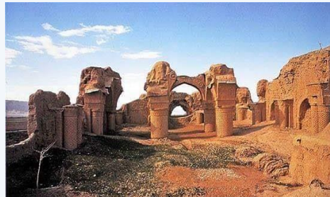
مسجد ۹ گنبد